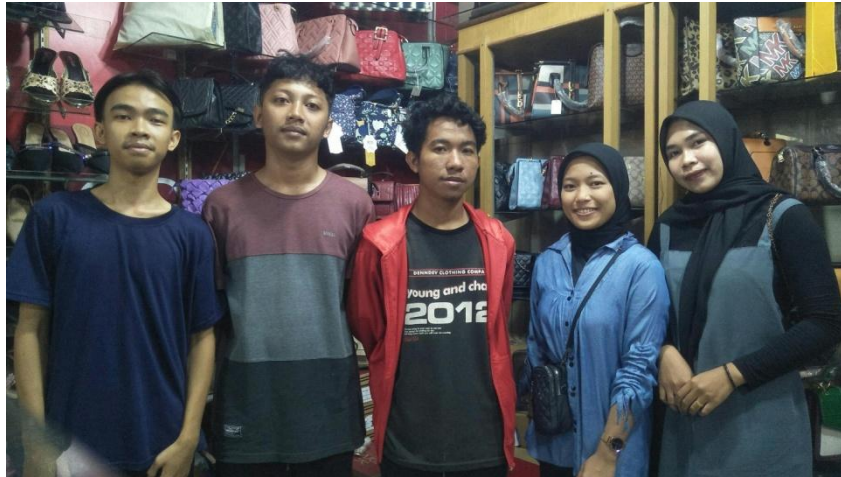
Gambar 1 Dokumentasi Kegiatan

Gambar 1 merupakan dokumentasi kegiatan pengabdian di toko Seventhree. Pelaksanaan kegiatan pengabdian ini dilakukan melalui beberapa tahapan yang tersusun secara sistematis agar tujuan kegiatan dapat tercapai dengan baik. Tahap pertama adalah identifikasi masalah, di mana peneliti melakukan pengamatan awal serta wawancara dengan kasir Toko Seventhree untuk mengetahui kondisi nyata yang terjadi dalam proses rekapitulasi penjualan. Pada tahap ini ditemukan bahwa proses pencatatan penjualan masih dilakukan secara sederhana dan belum memanfaatkan fitur-fitur yang tersedia pada Microsoft Excel secara optimal, sehingga proses pengolahan data belum berjalan secara efisien.